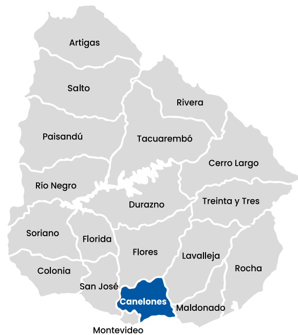
Gráfico 1 Uruguay y sus departamentos

El departamento tiene una superficie de 4.536 km 2 , de los que 65 km corresponden a playas sobre el Río de la Plata, con 30 balnearios con entorno natural. A su vez, cuenta con 2.897 km de caminería urbana y 3.817 km caminería rural, El 91 % de su población es urbana y el 75 % reside en localidades urbanas mayores a 5.000 habitantes. Está descentralizado en 30 municipios 2 , y su capital, la ciudad de Canelones, es la sede administrativa del Gobierno Departamental y de variados servicios nacionales.