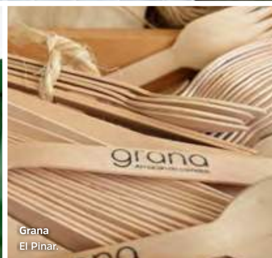
Grana El Pinar.