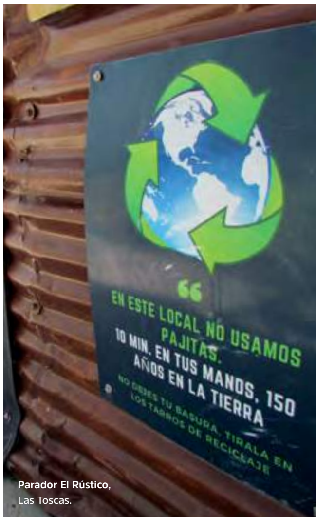
Parador El Rústico, Las Toscas.

Evitá la entrega de bolsas descartables cumpliendo con la Ley de bolsas plásticas N.º 19.655. Recordá que las bolsas transparentes plásticas solo están permitidas para contener directamente alimentos (carnes, pescado, frutas, verduras, etc.) y no para transportar mercadería. El cobro de las bolsas compostables tiene como fin desestimular su uso.