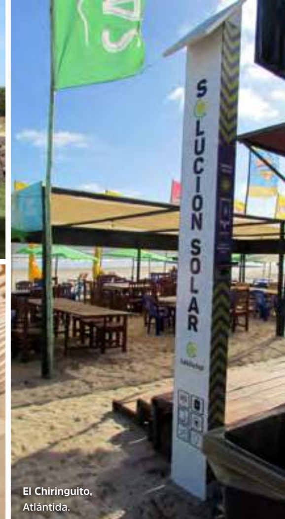
El Chiringuito, Atlántida.