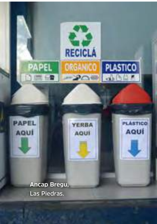
Ancap Bregu, Las Piedras.