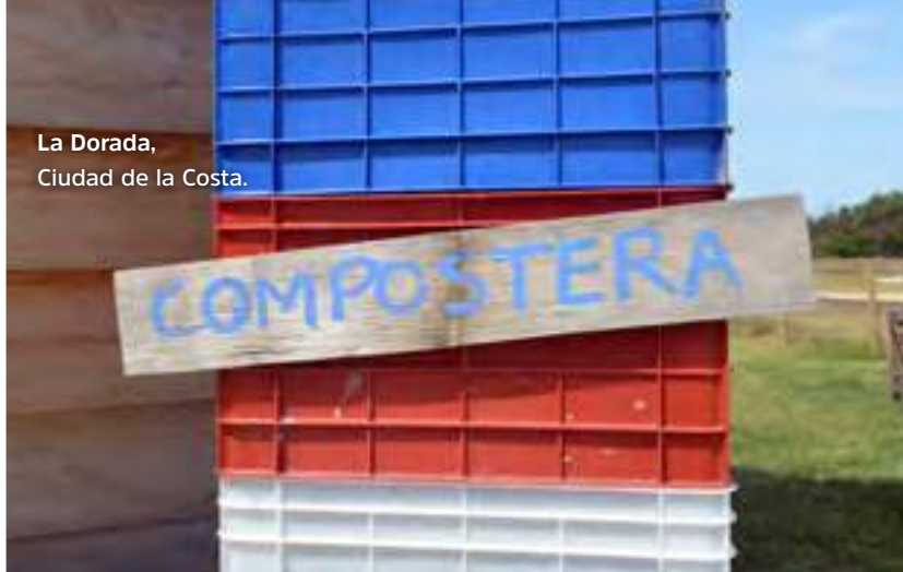
La Dorada, Ciudad de la Costa.