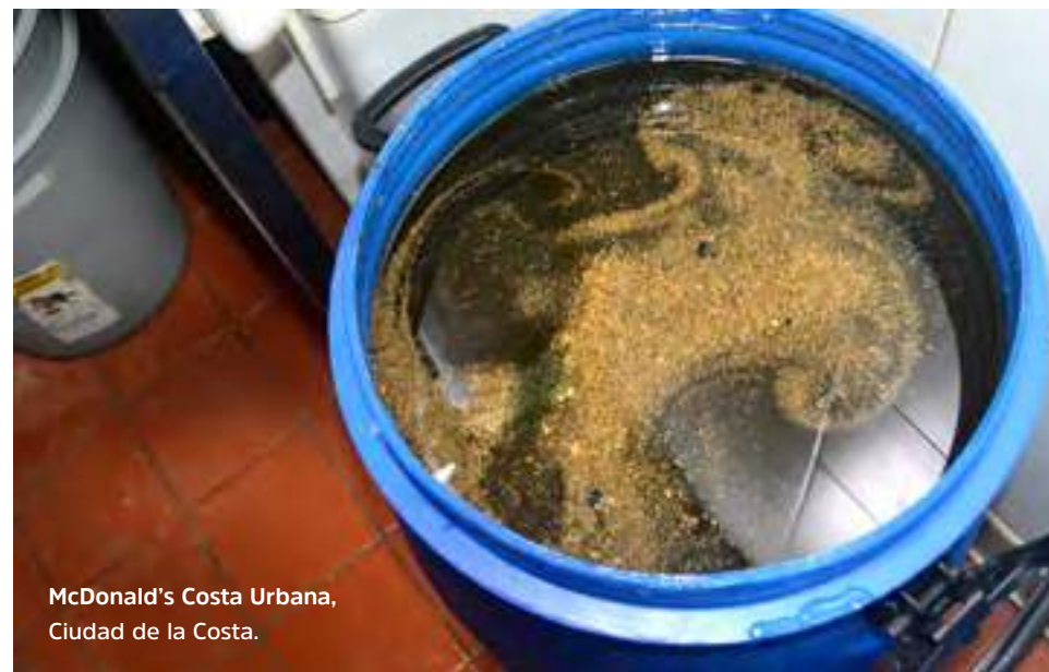
McDonald's Costa Urbana, Ciudad de la Costa.