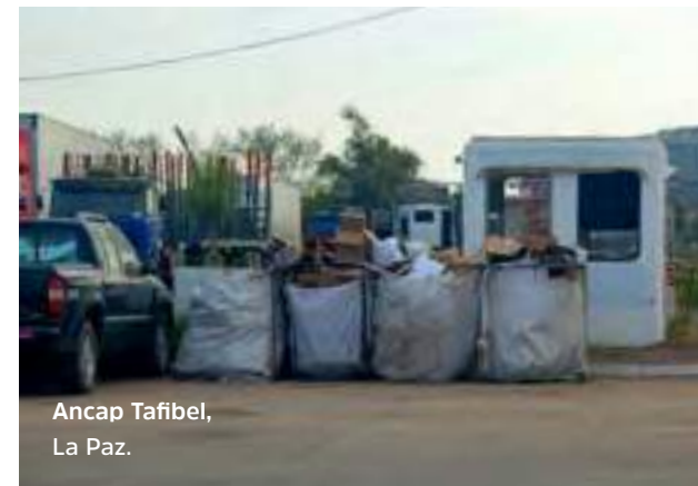
Ancap Tafibel, La Paz.