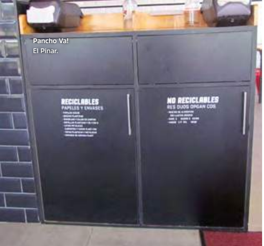
Pancho Va! El Pinar.