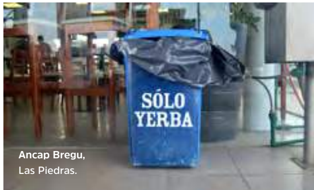
Ancap Bregu, Las Piedras.

Consultá por donación de alimentos y mercaderías en la secretaría u oficina desarrollo humano de tu municipio, en la Red de Alimentos Compartidos , en el Banco de Alimentos , u organizaciones similares.