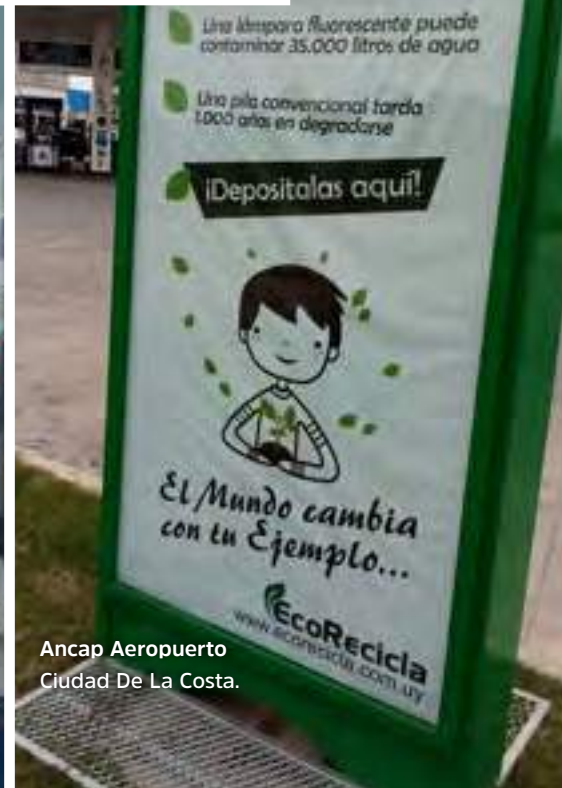
Ancap Aeropuerto Ciudad De La Costa.