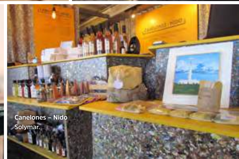
Canelones - Nido Solymar.