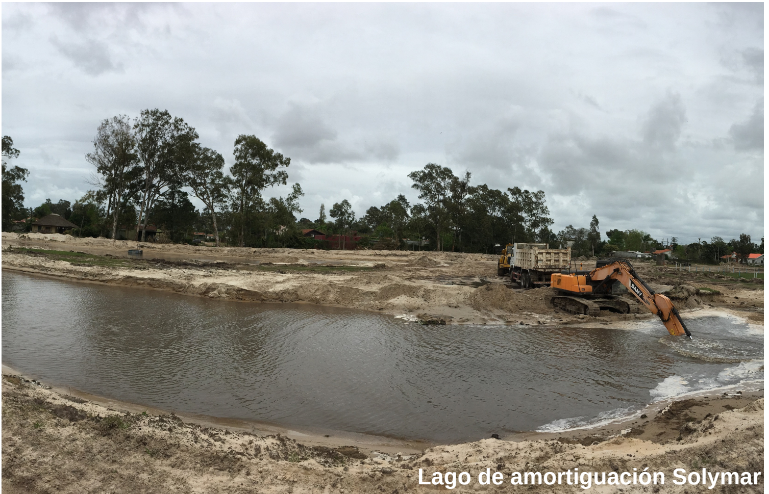
Lago de amortiguación Solymar