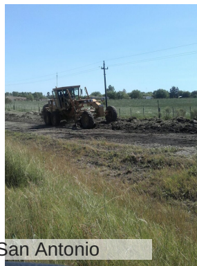
Ciclovía San Antonio