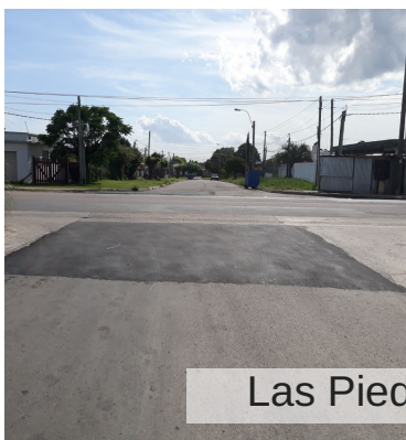
Las Piedras- Julio Sosa