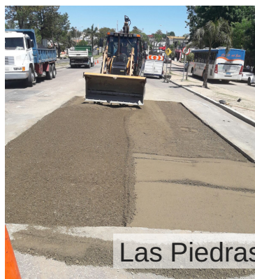
Las Piedras- Bicentenario